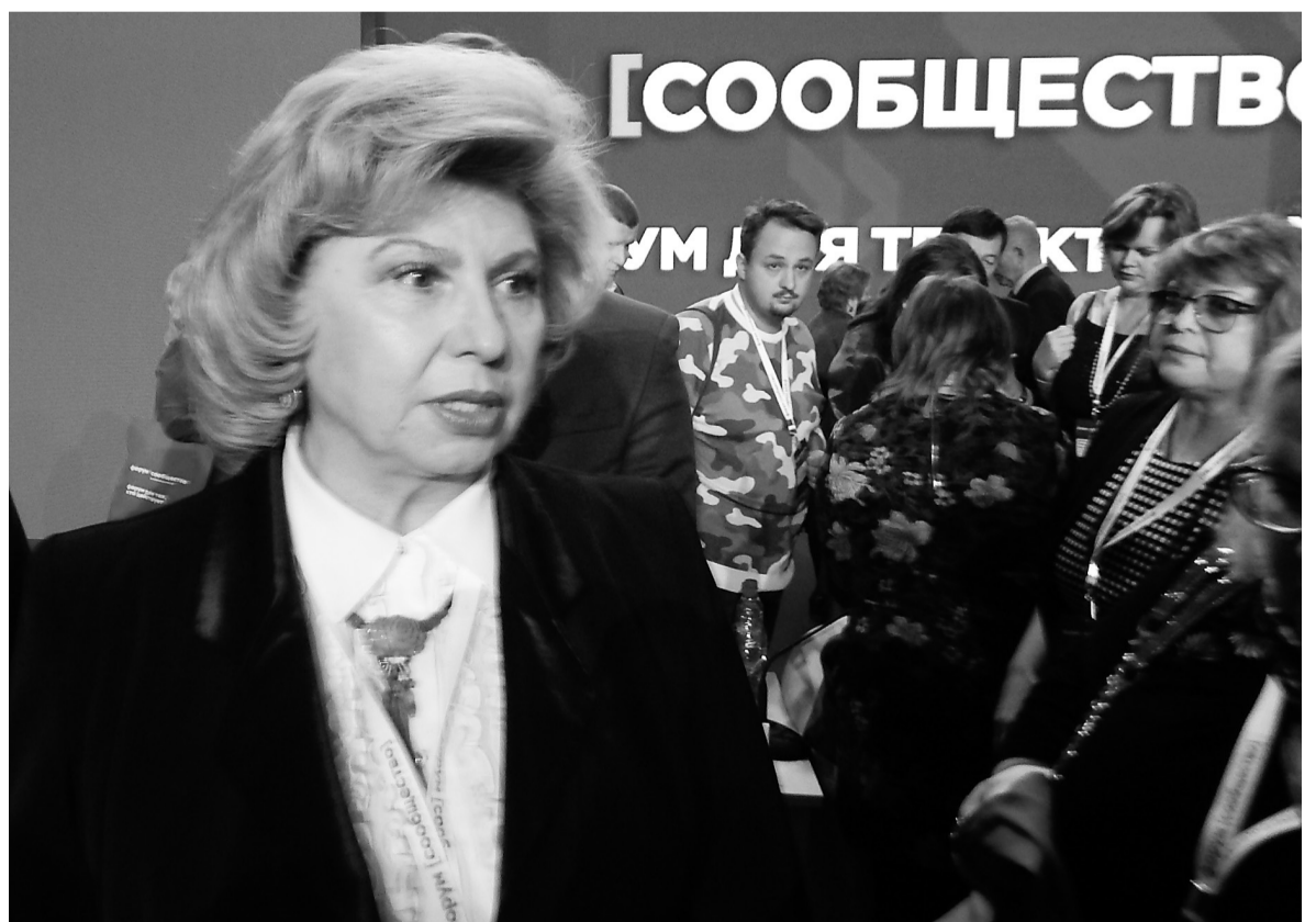
На московском форуме «Сообщество» мы попросили помощи у уполномоченного по правам человека в РФ Татьяны Москальковой.

К 2014 году все мое имущество уже было перерегистрировано в украинском реестре за оффшор-