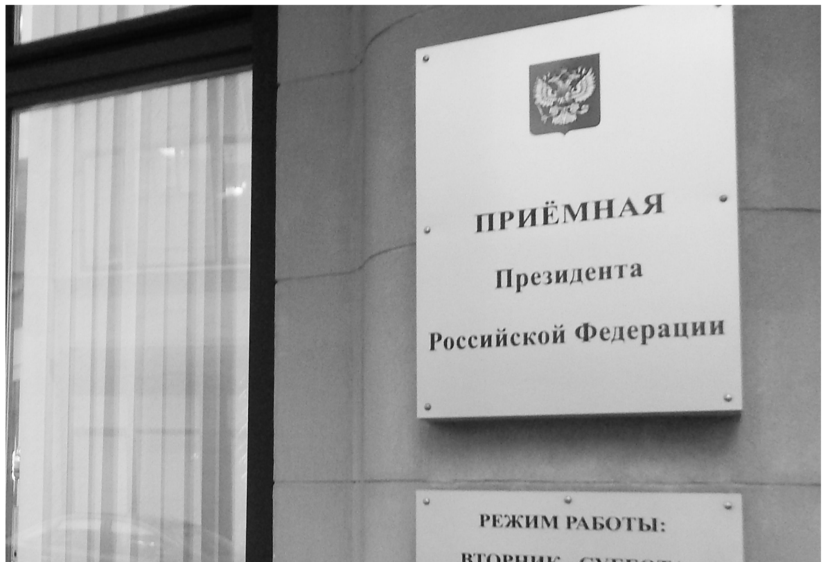
Этот номер нашей газеты будет передан в приёмную Путина в Москве — ул. Ильинка, дом 23/16, подъезд 11.